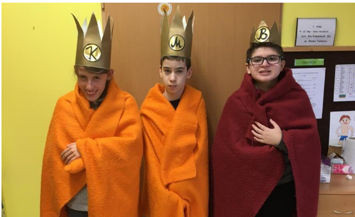
Připomínka svátku Tři Králů na třídách