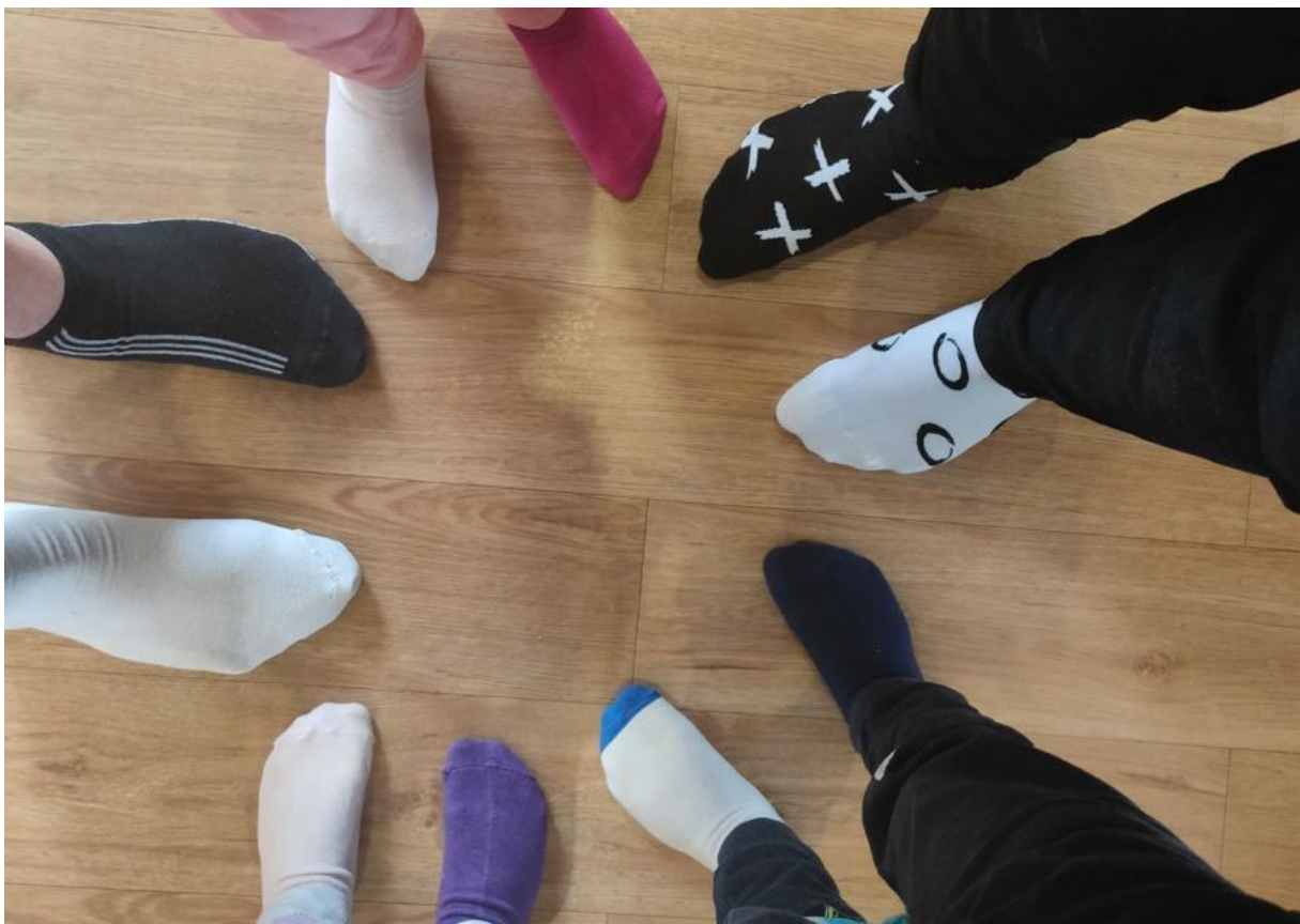
Ponožkový den, podpora celosvětového dne lidí s Downovým syndromem