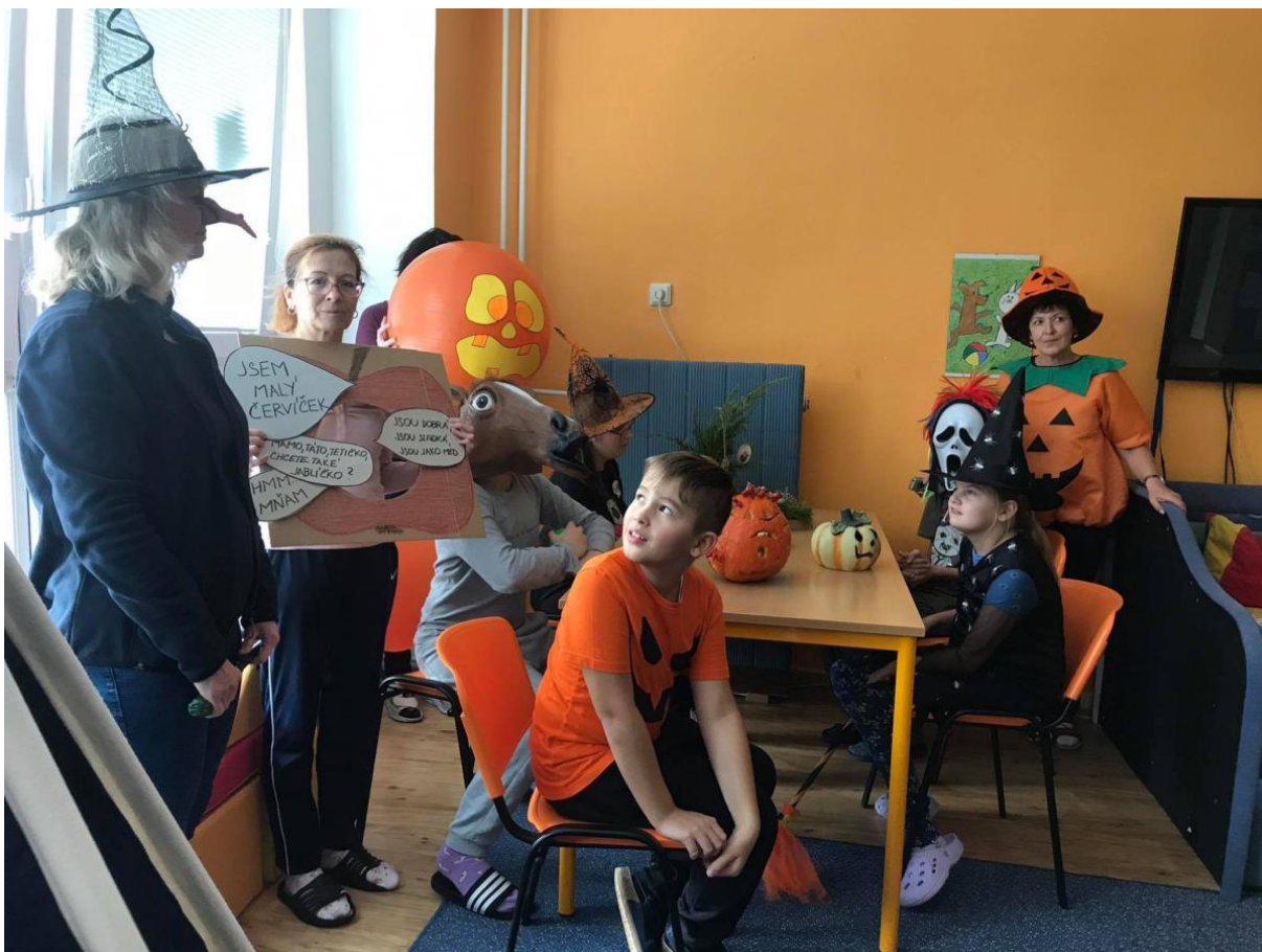
Malý Halloweenský karneval ve školní družině