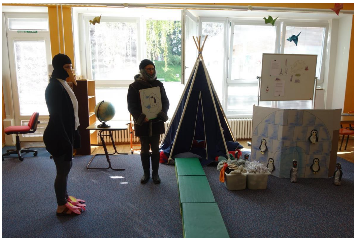
Hry bez hranic (Cesta kolem světa)