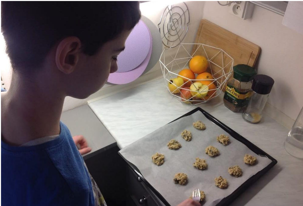
Pečeme zdravé sušenky dle návodu – úkol distanční výuky