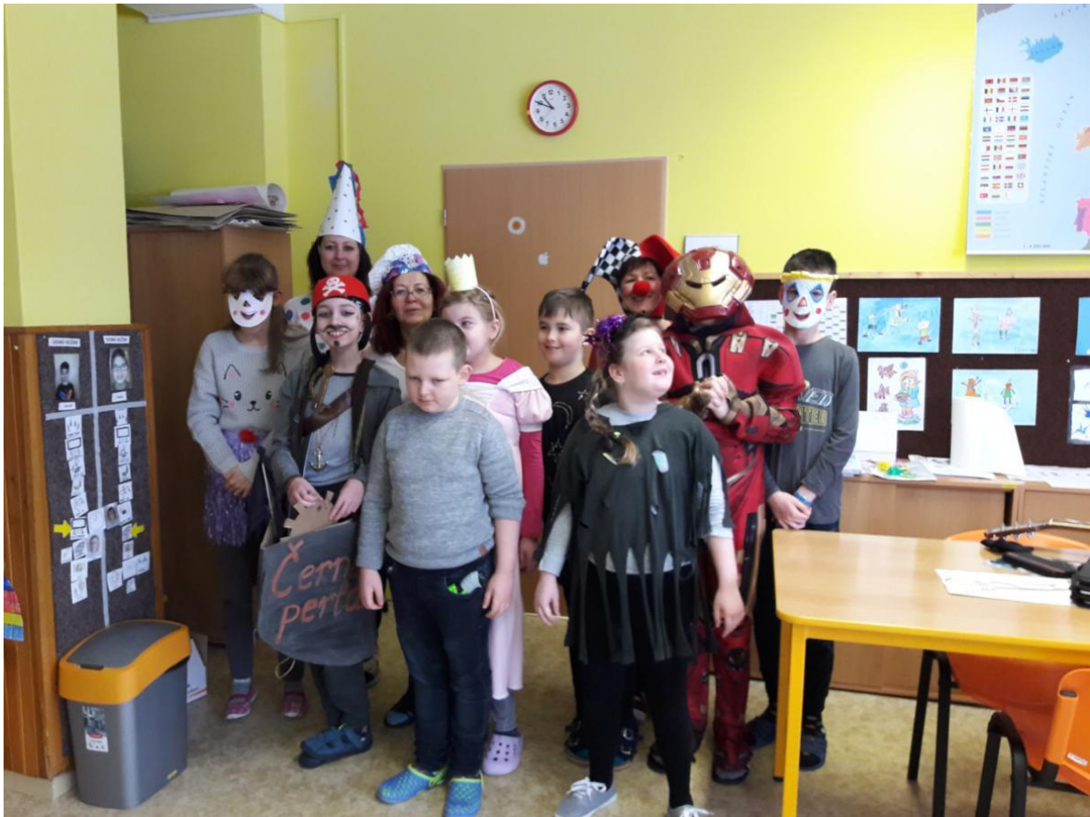
Slavíme Masopust (na třídách)