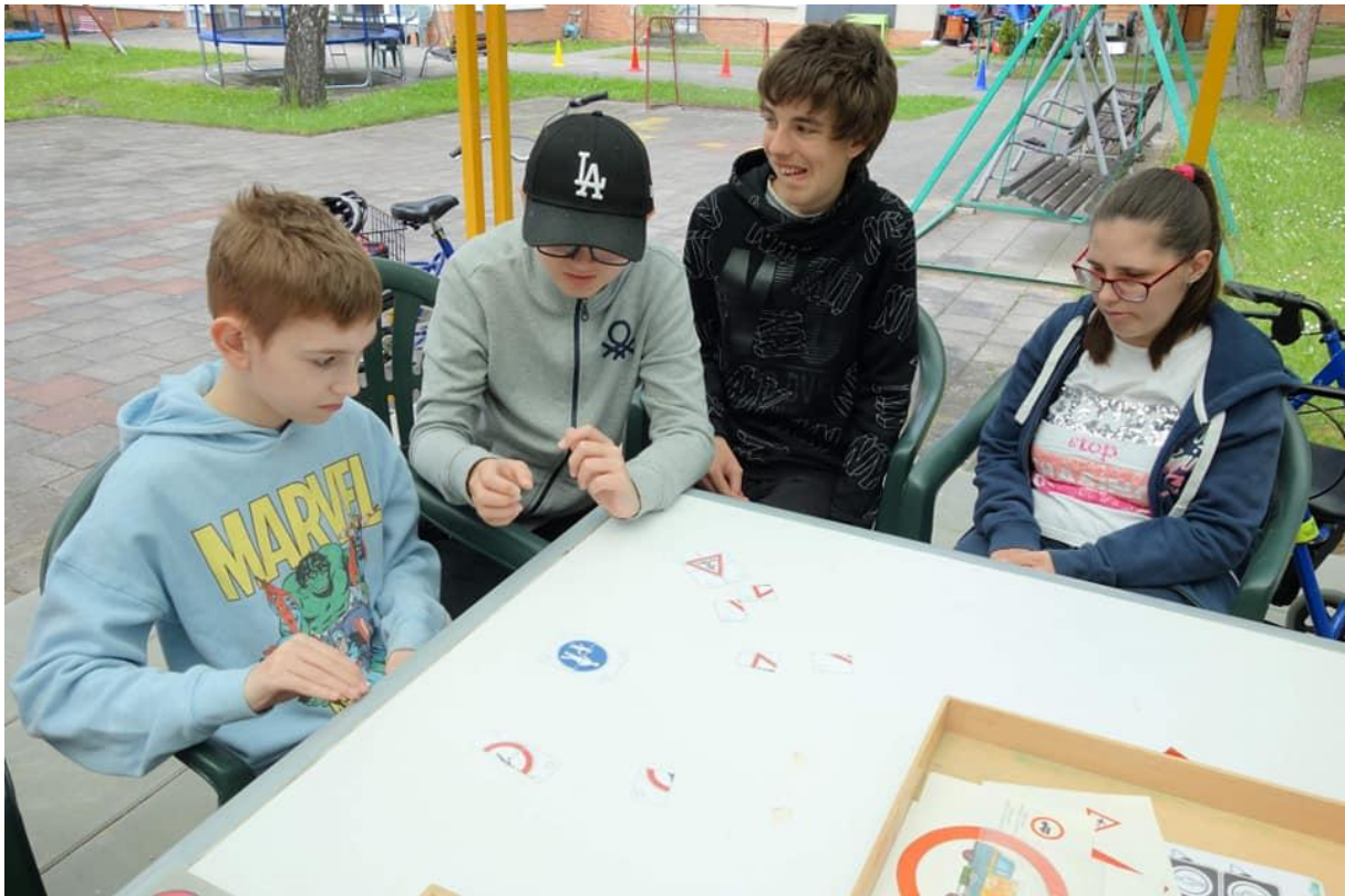
Dopravní dopoledne ve školní družině