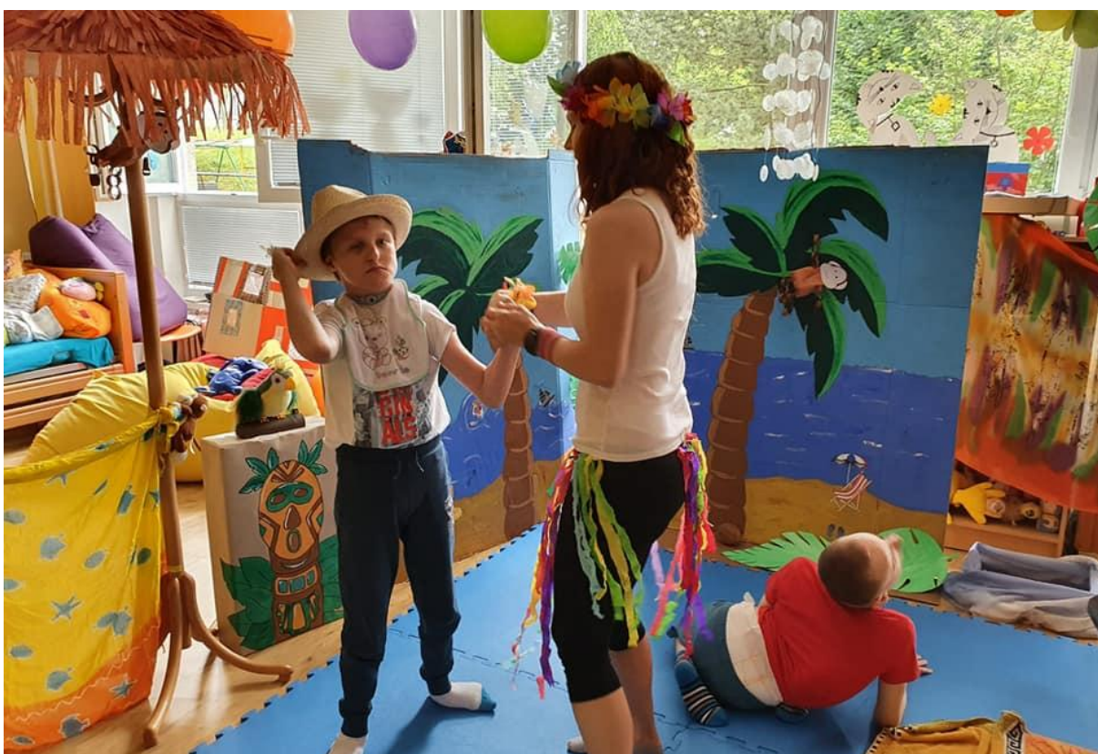
Lockdown – když nemůžeme na výlet, uděláme si výlet ve třídě