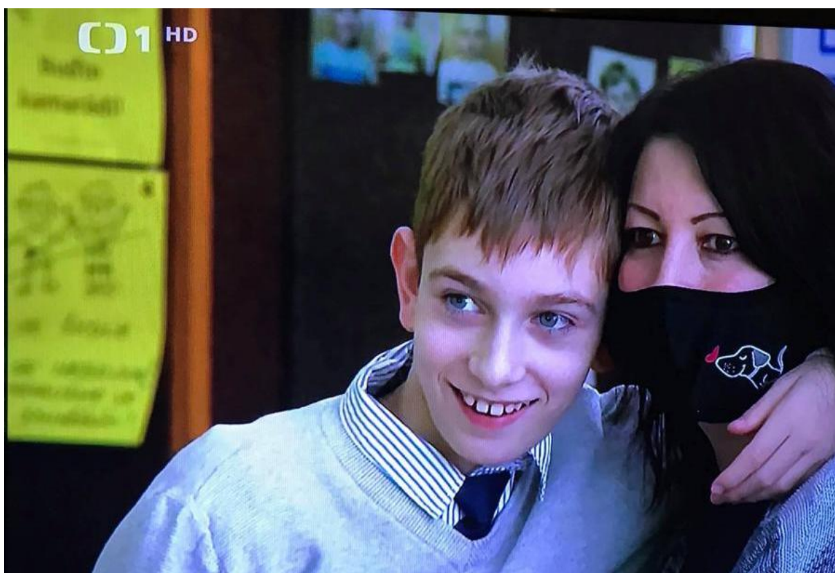
Divadelní představení Městského divadla Zlín – probíhalo online, návštěva štábu České televize v naší škole