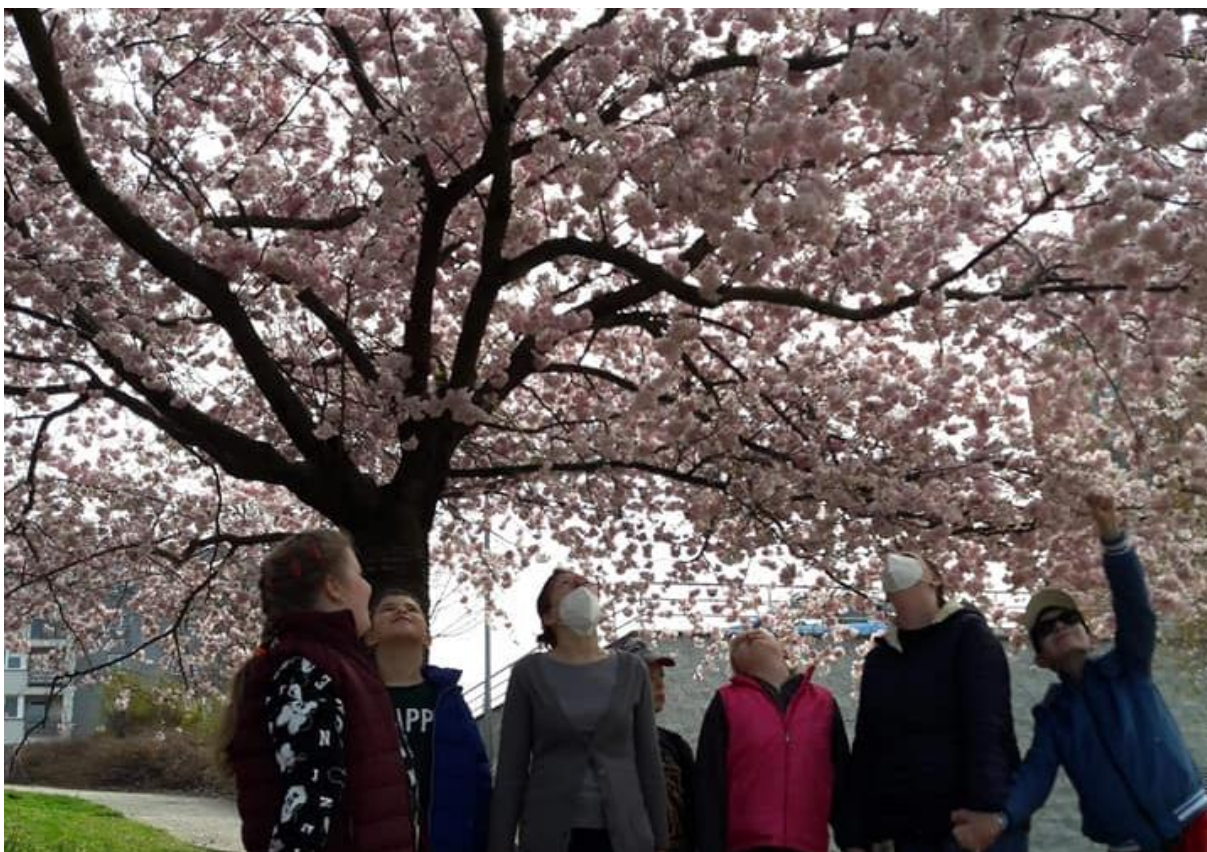
Svátek kvetoucích stromů