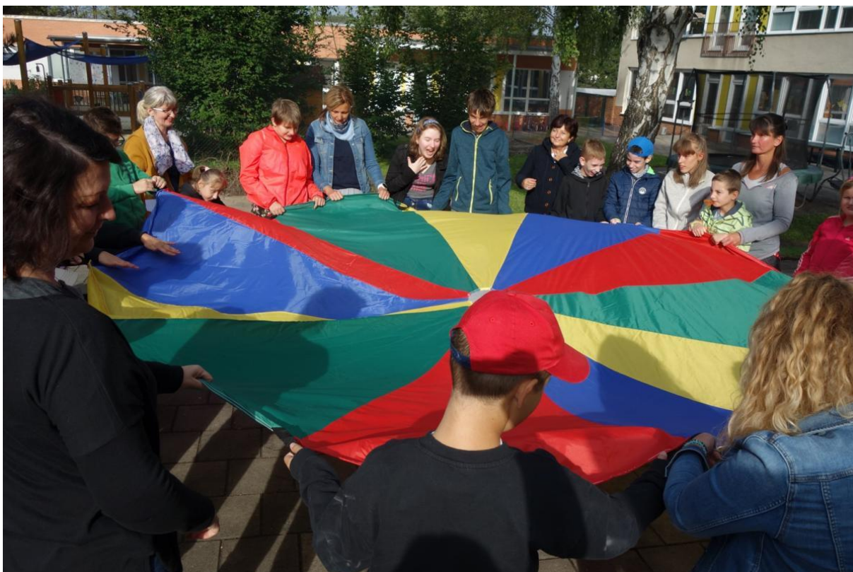
Zahájení školního roku – hrajeme si a opékáme špekáčky na školní zahradě