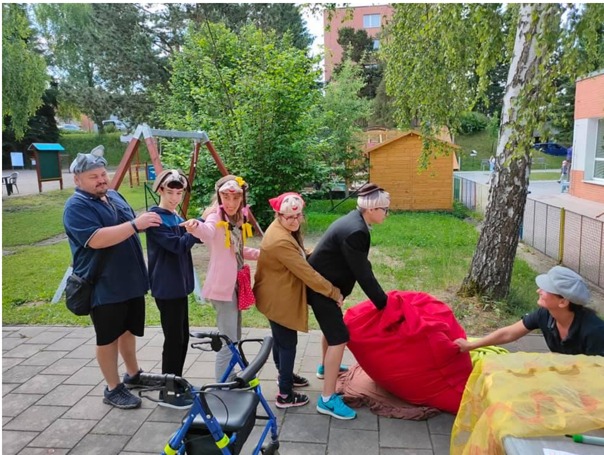
Z pohádky do pohádky