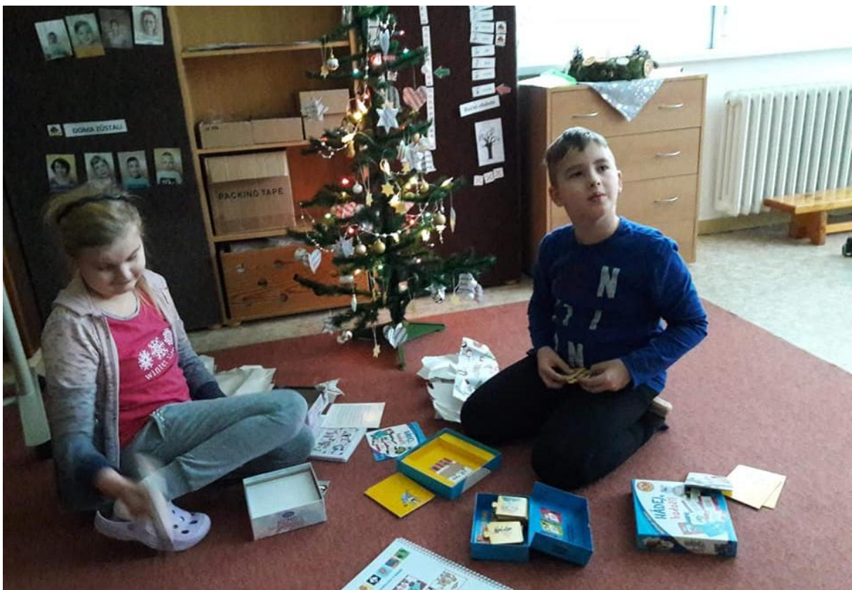
Vánoční nadílky ve třídách