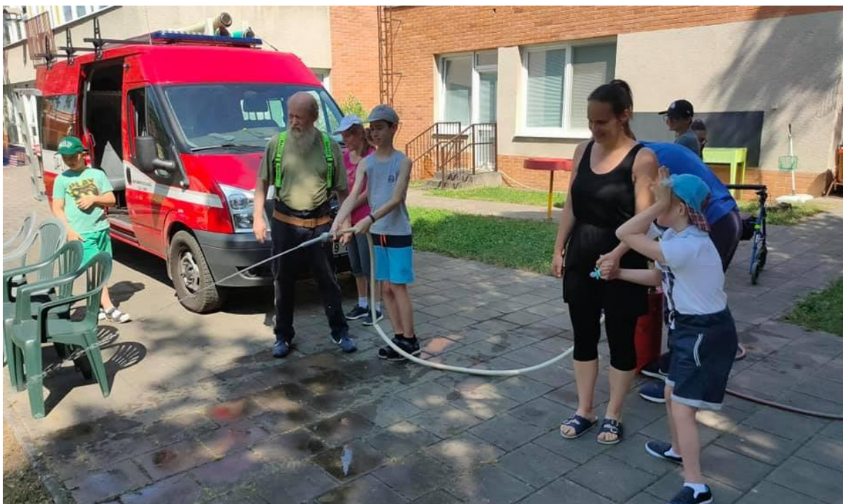
Návštěva hasičů HSZLK