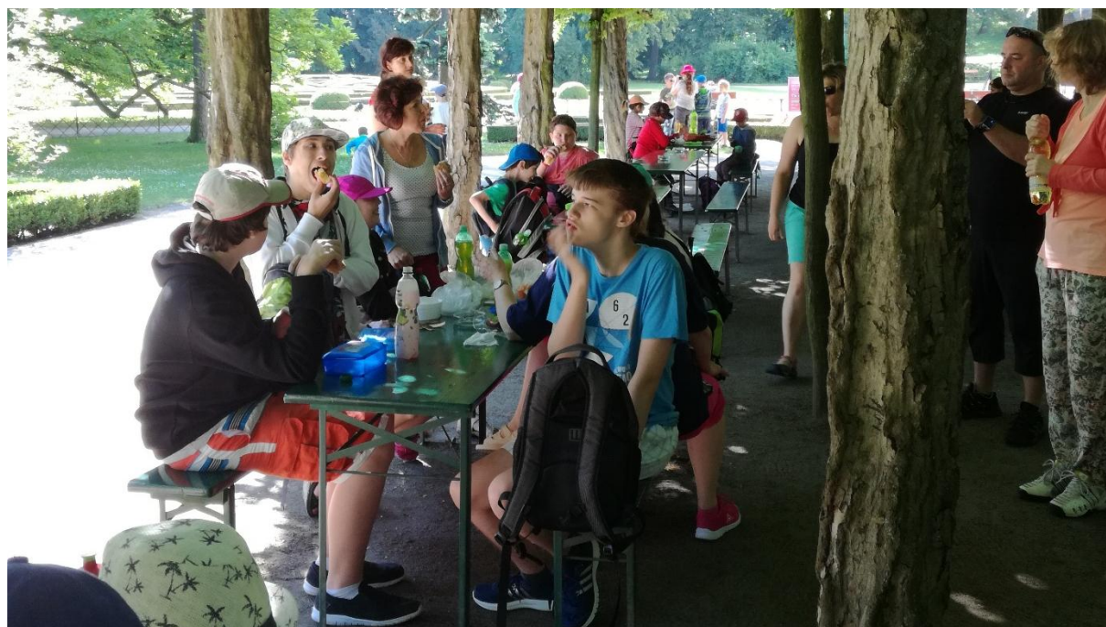
Školní výlet Kroměříž