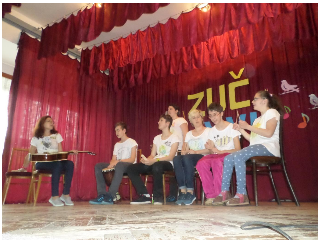
ZUČ Smolina – 3. místo