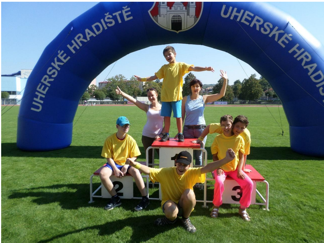
Speciální olympiáda Uherské Hradiště