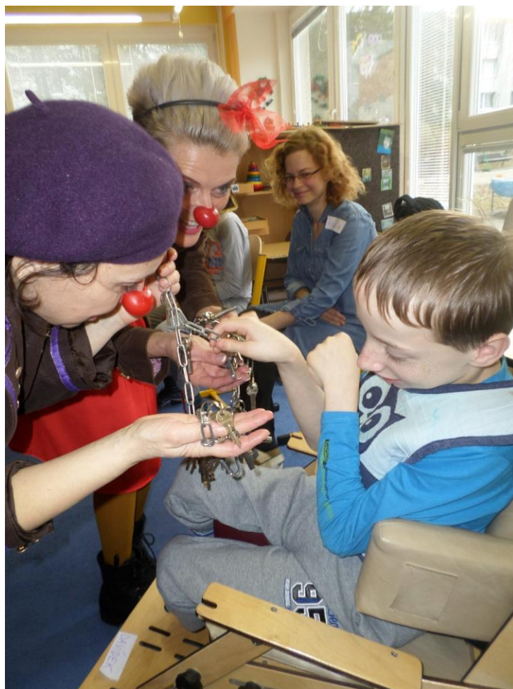
Zdravotní klauni – hudební program Kutálka