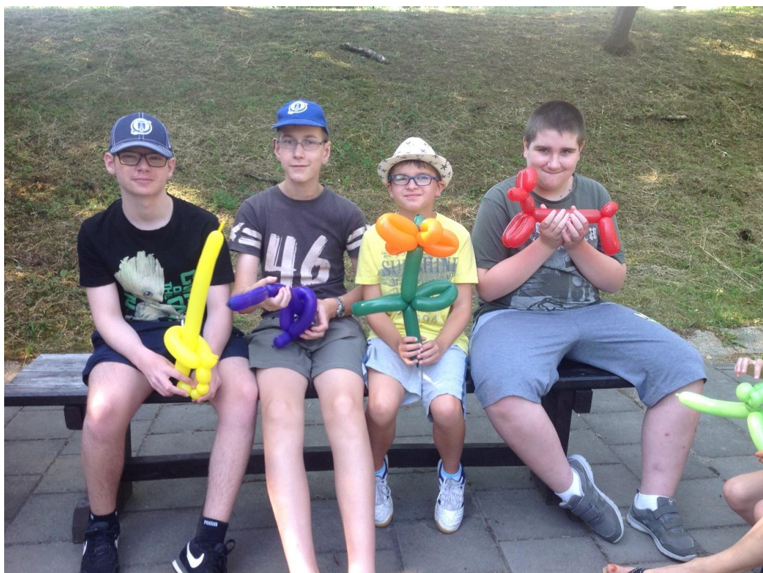
Loučení se školním rokem