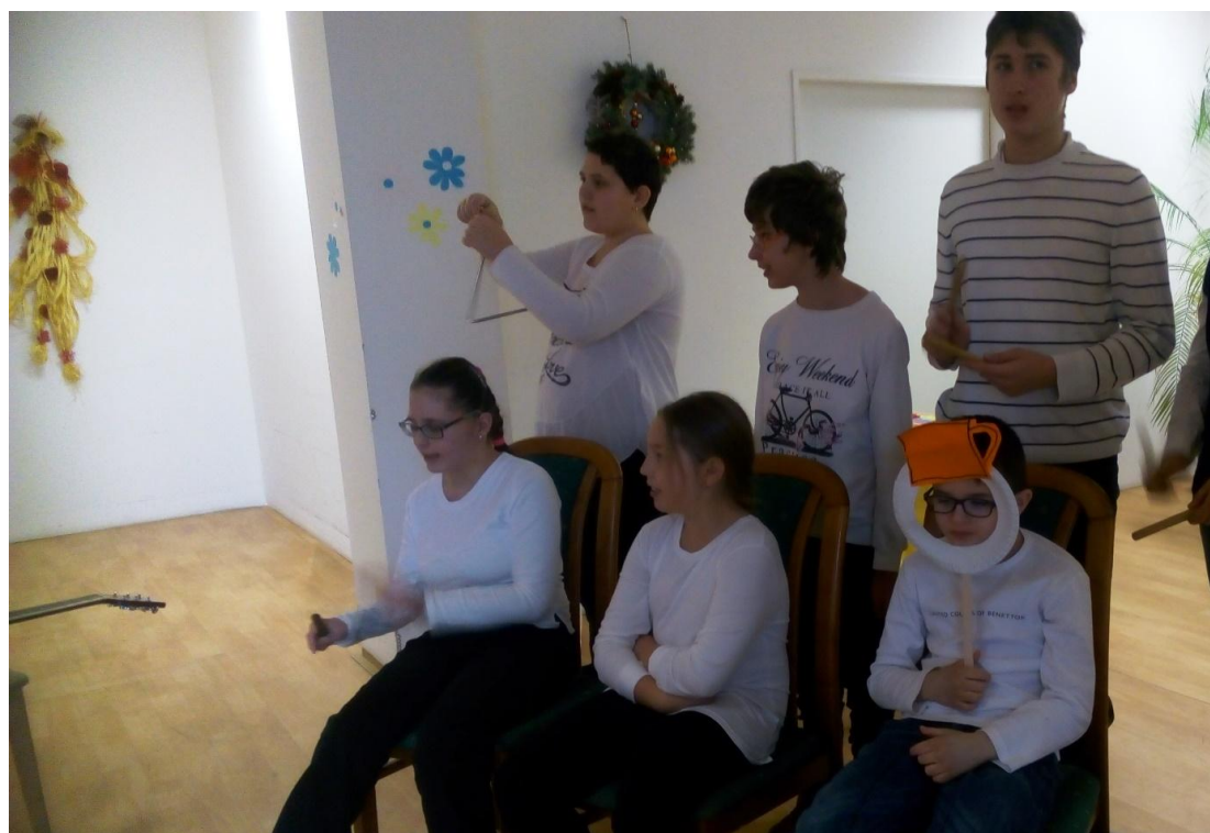
Vystoupení ve HVĚZDĚ z.ú.