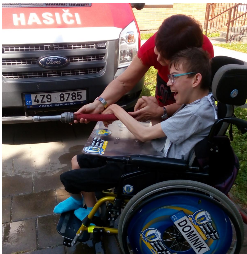
Hasiči – vyhlášení výtvarné soutěže