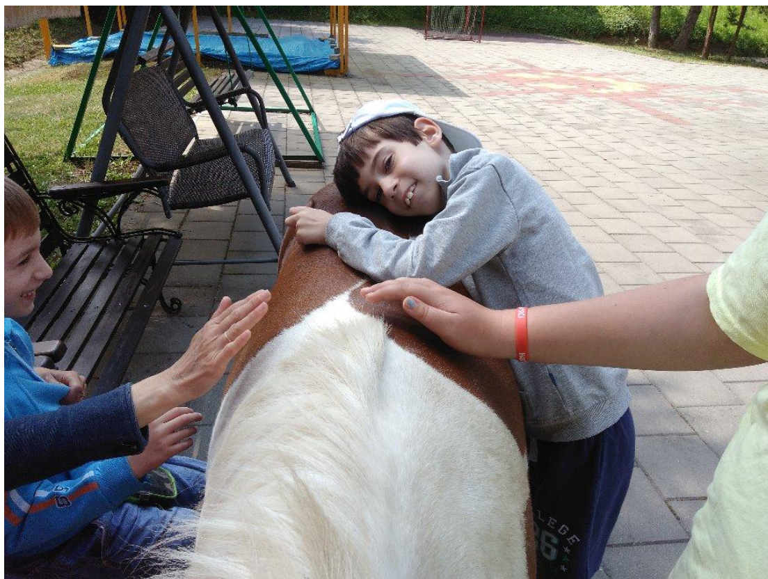
Terapie s ponym Zonki