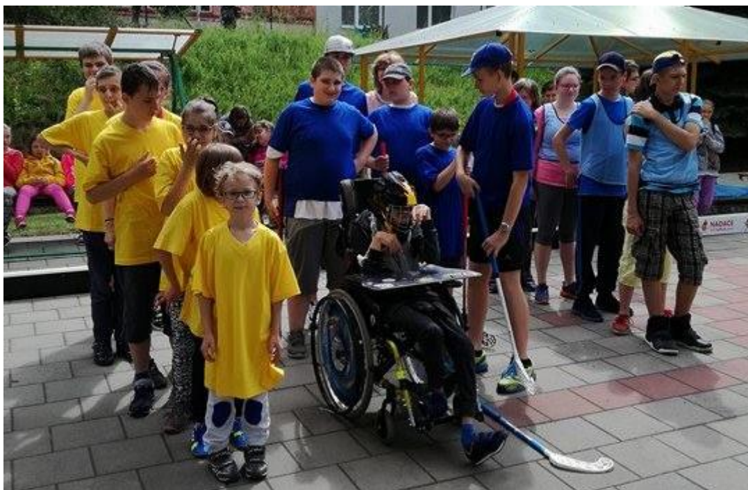
Florbalový turnaj speciálních škol