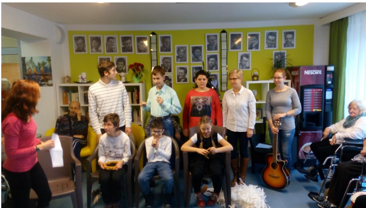
Vystoupení v Alzheimercentru ve Zlíně