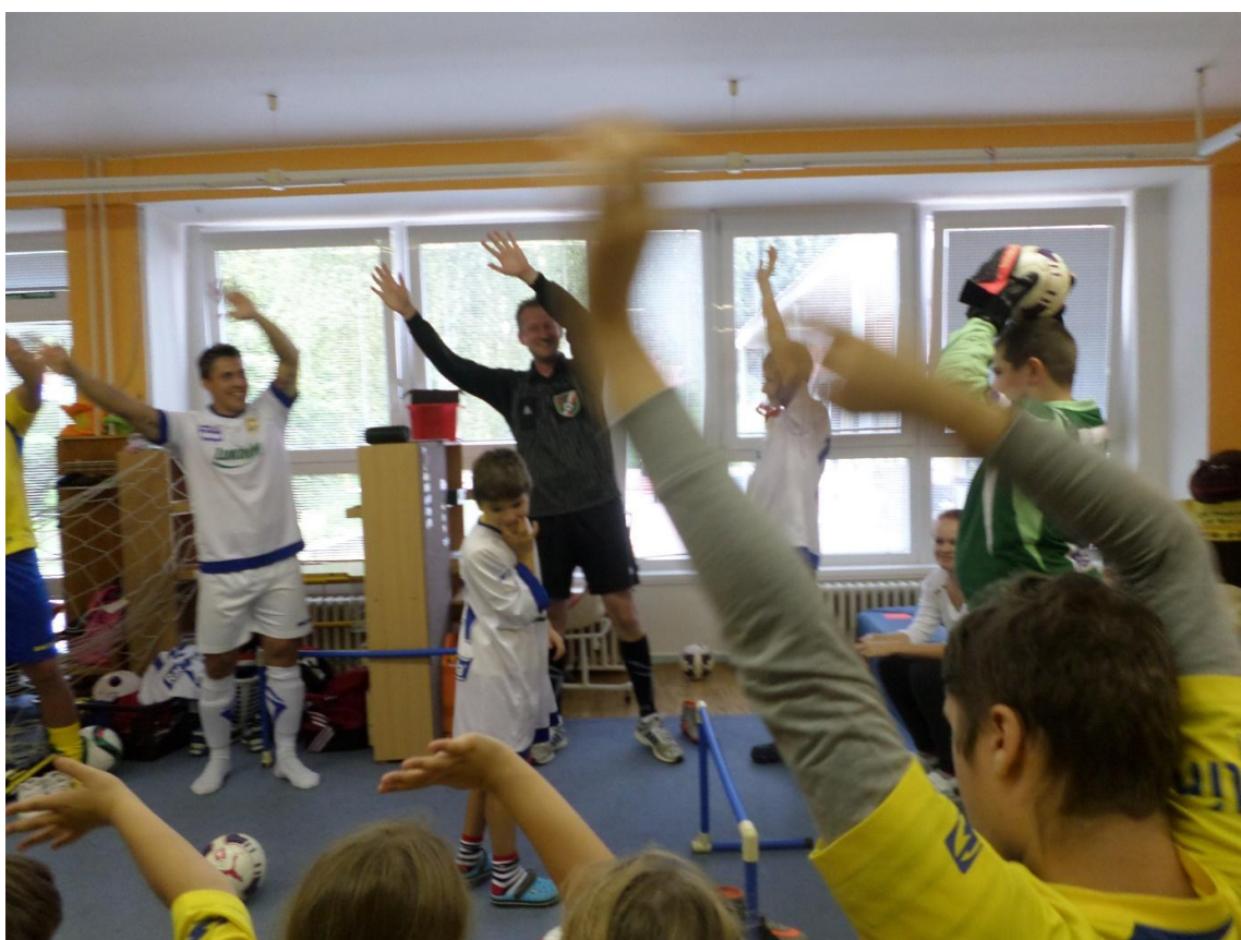
Fotbalisté z FC Fastav Zlín ve škole